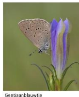
Gentiaanblauwtje Klokjesgentiaan Bossteekmier of moerassteekmier

Het Gentiaanblauwtje is een vrij zeldzame vlindersoort van vochtige heide, waarvan de eitjes vaak gemakkelijker zijn te vinden dan de vlinders. Het is een dagvlinder en de naam zegt het al, hij maakt deel uit van een uitgebreide familie blauwtjes. Enkele voorbeelden zie je op het plaatje. Het Groentje is dus ook een blauwtje.