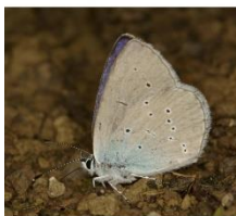
Klaverblauwtje Rode klaver, wondklaver