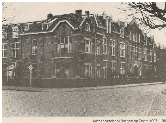
Ambachtsschool Bergen op Zoom 1907 - 1981

Het is best goed gekomen dus en ben mijn moeder dankbaar dat ze dit alles voor mij bewaard heeft....en als klap op de vuurpijl op een goed moment zelfs zei "ik wil niet meer emigreren maar hier blijven". Moeders wil was wet. Punt uit. Het heeft mij veel goeds gebracht. Zeker weten.