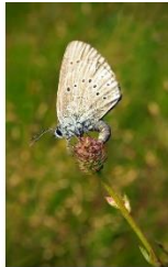
Pimpernelblauwtje Grote pimpernel Moerassteekmier