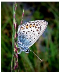
Heideblauwtje Struikhei en dophei Humusmier (schubmier)