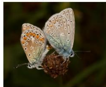
Icarisblauwtje Gewone rolklaver, hopklaver, enz.