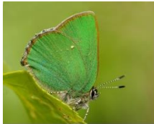
Groentje Brem, braam, bosbes enz.

De vorige keer heb ik beloofd het een en ander te vertellen over het beheer van het gebied Boterbergen - Stappersven - De Nol. Daar ga ik nu op in aan de hand van bijzondere wetenswaardigheden die ik bij gelegenheid ook vertel als ik een groep gids. Nu bijvoorbeeld over het mysterie van het Gentiaanblauwtje.